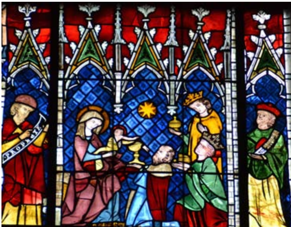
Anbetung der Heiligen Drei Könige, Glasmalerei Straßburger Münster

Kirchengemeinde St. Katharinen, Salzwedel Kirchspiel Kuhfelde Kirchspiel St. Georg, Salzwedel, Kirchspiel Groß Chüden