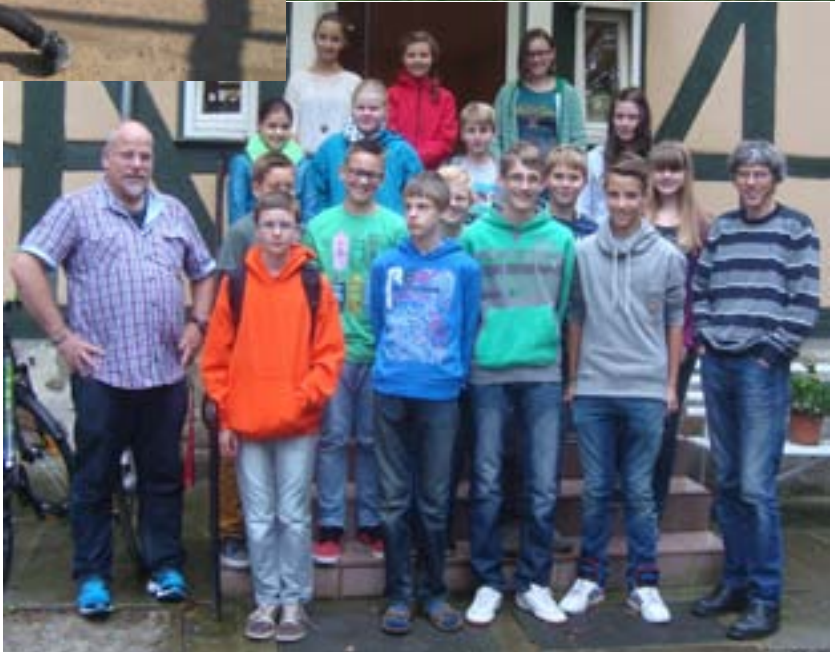
Oben: Hütteneinweihung, Mitte: Pfadfinder im Harz, Unten: Konfirmanden und Vorkonfirmanden