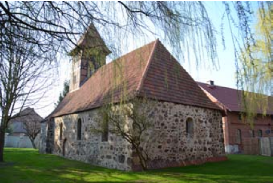
Kirche in Siebeck

Hohenlangenbecker Kirche ist geplant, eine neue Dachdeckung vorzunehmen, und in Siedenlangenbeck soll eine Dachrinne künftig dafür sorgen, dass die extremen Feuchtigkeitsprobleme beim Fußboden der Kirche behoben werden können. Dort feiern wir am 14.12. übrigens wieder unseren traditionellen Adventsgottesdienst mit Chor.