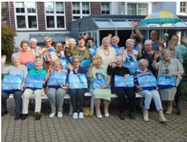
Seniorenfreizeit in Timmendorf