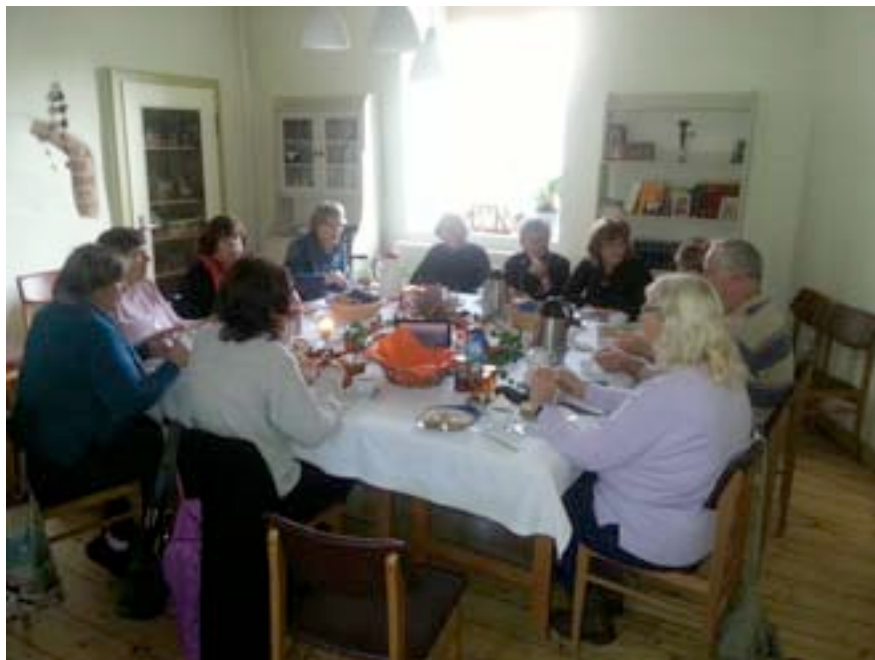
Offenes Gemeindefrühstück St. Katharinen, 11.11.