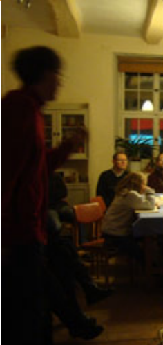
Katharinenabend zum Turiner Grabtuch