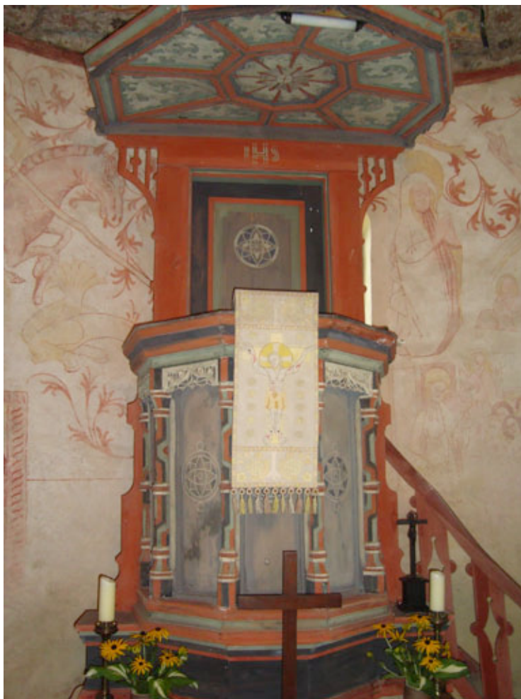
Kanzel in Hohenlangen- beck

Kanzel restauratorisch bearbeitet werden. Die Kanzel beansprucht auch deshalb besonderes Interesse, weil der Korb offensichtlich aus Teilen der Flügel eines mittelalterlichen Altarschreines zusammengesetzt wurde.