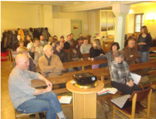
links oben: Familiengottes- dienst Katharinen am 17.2.