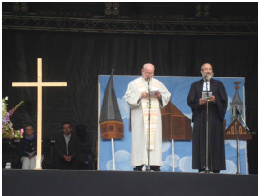
Gottesdienst zum Hansefest 2012

Katharinenkirche stattfinden wird. Diese Konzerte werden deutschlandweit im Radio übertragen. Das Freiburger Barockorchester wird dort spielen, und wir alle hoffen, dass der eigentliche Zweck - nämlich die Wiedereröffnung des Westvorbaus - bis dahin tatsächlich erreicht ist. Die Arbeiten dort schreiten nun jedenfalls wieder gut voran, nachdem der harte Winter zu einigen Verzögerungen geführt hatte.