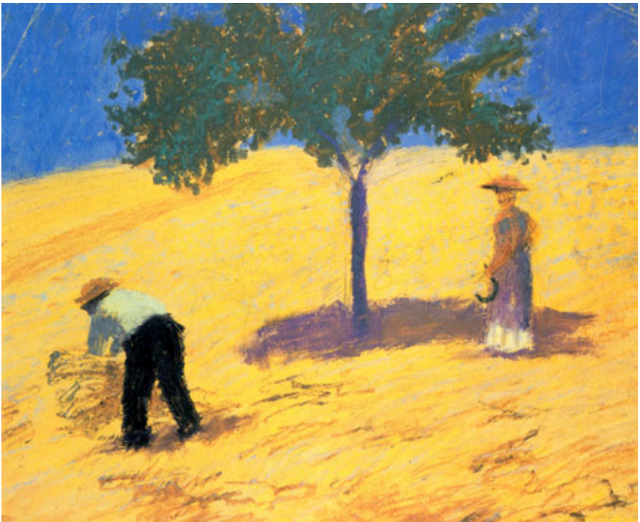
August Macke, Baum im Kornfeld, 1907

Kirchspiel St. Georg, Salzwedel Kirchengemeinde St. Katharinen, Salzwedel Kirchspiel Kuhfelde