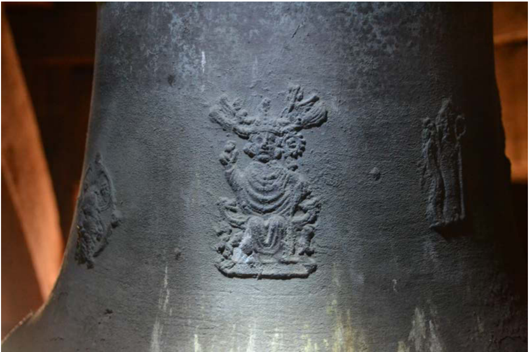
Glocke der Getraudenkapelle Salzwedel

Kirchengemeinde St. Katharinen, Salzwedel Kirchspiele St. Georg, Salzwedel, Groß Chüden, Kuhfelde