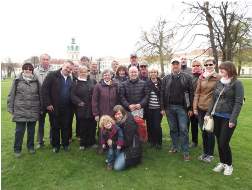
Gemeinsame GKR Fahrt St. Georg und St. Katharinen nach Berlin