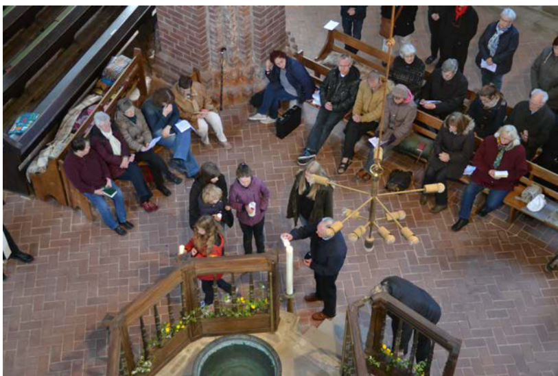
Tauferinnerungsgottesdienst am 24. April in St. Katharinen