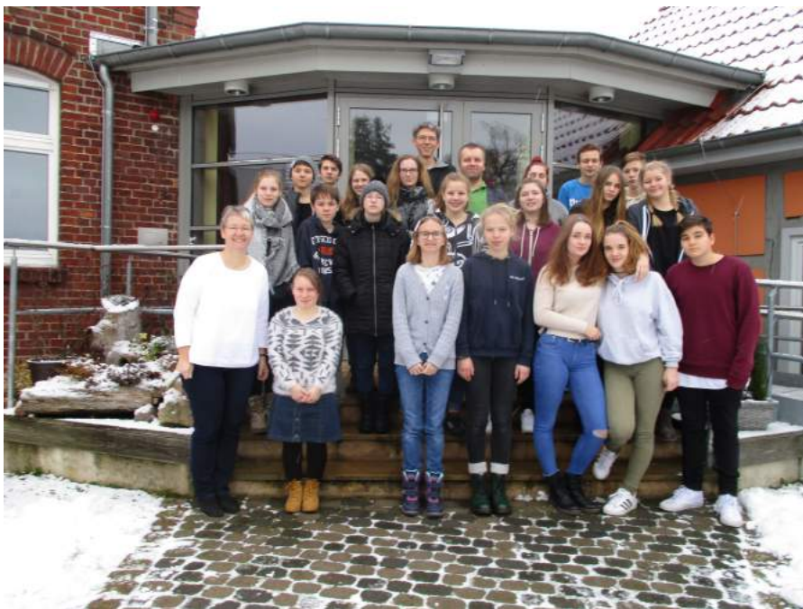
Konfirmandenrüstzeit in Zethlingen