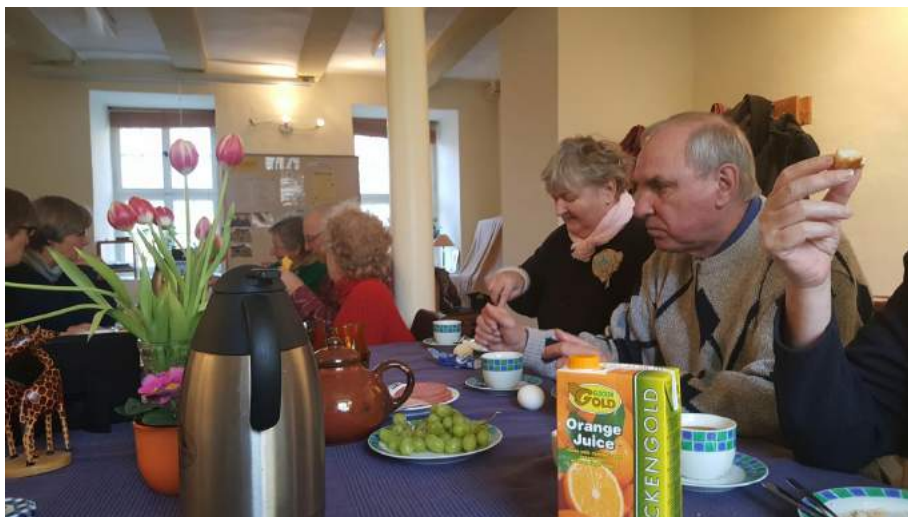
Offenes Gemeindefrühstück in der Alten Lateinschule