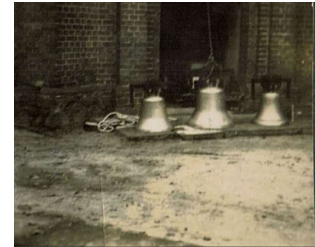
Zuguß zweier Glocken Anno 1963 in der St. Georg Kirche

Ab 16.00 Uhr wird die Salzwedeler Fanfaregarde mit einem Umzug, durch die Straße zur Perver Kirche, allen Einwohnern den Beginn des Ereignisses verkünden