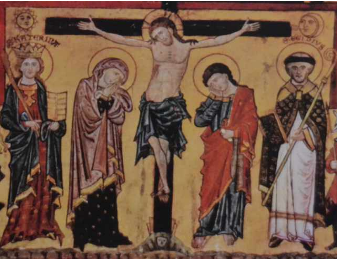
Retabel aus der Quedlinburger Ägidienkirche