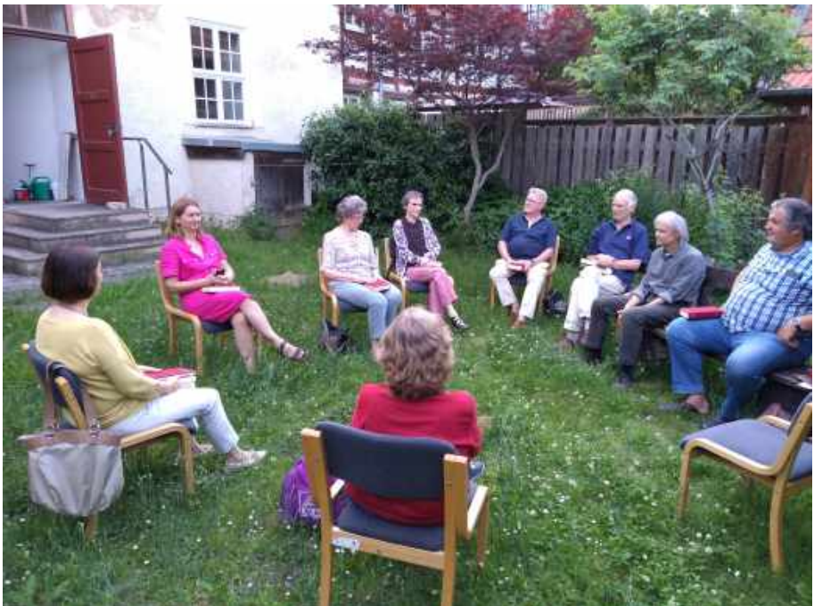
unten: der Bibelkreis trifft sich im Freien