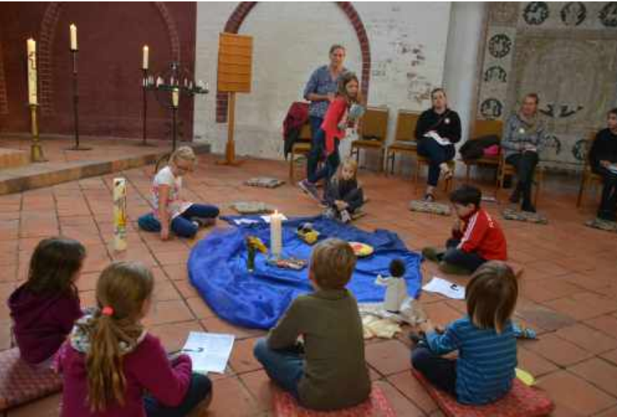
oben: erstes Familienkirchen- Treffen nach der Corona-Pause