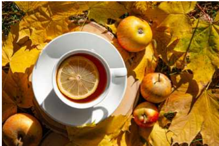
N. Schwarz © GemeindebriefDruckerei.de