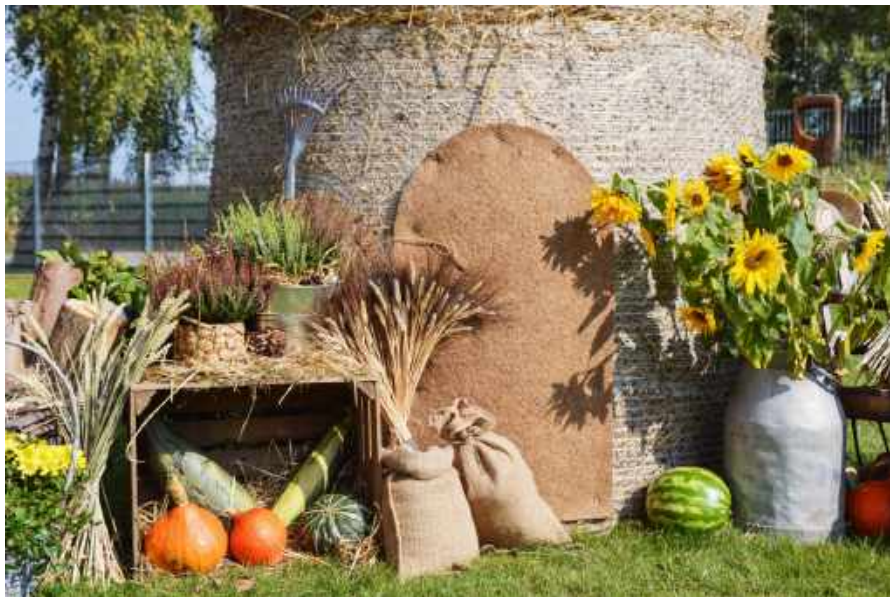
N. Schwarz © GemeindebriefDruckerei.de