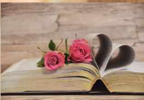
N. Schwarz © GemeindebriefDruckerei.de