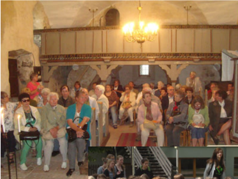
oben: Gemeindeausflug am 27.5., Besichtigung der Kirche Mahlsdorf rechts: Konfi-Camp in Arendsee