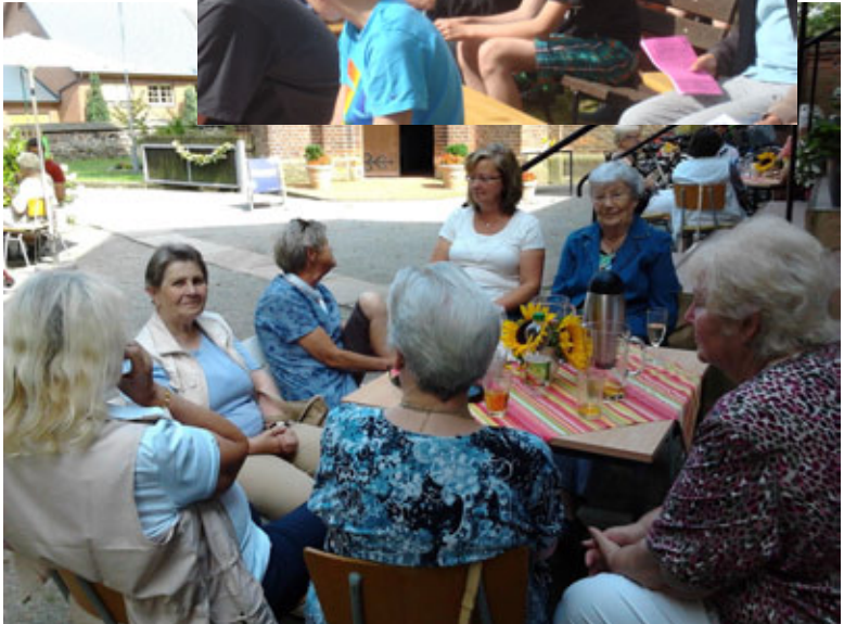
Kaffeetrinken in St. Georg