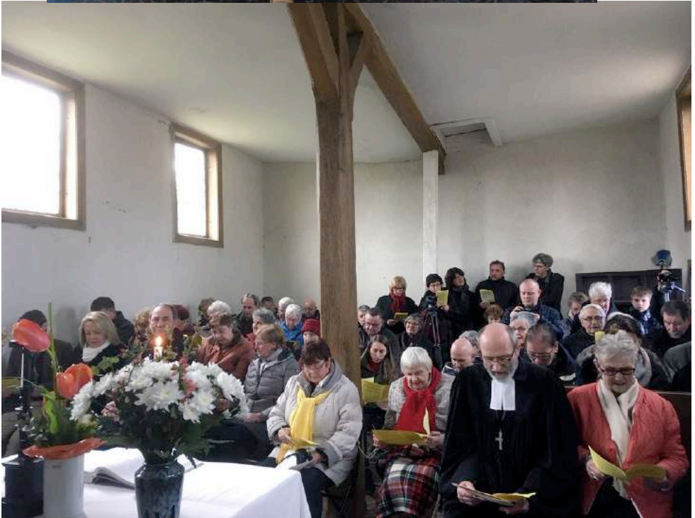
Oben: Seniorenfreizeit Timmendorf, Unten: Abschied von der Kirche in Klein Chüden, Fotos J. Thurn, M. Friske