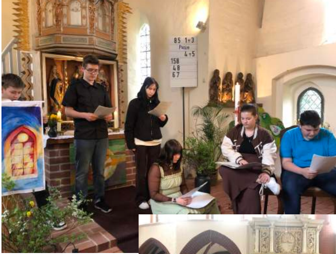
Vorstellungsgottesdienst Konfis 23.4., Jugendkreuzweg 31.3., Kirchenputz 1.4., Segen-to-go und Osternacht 8.4.