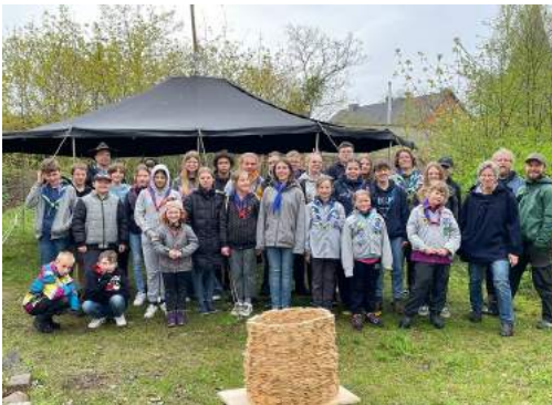
Gruppenfoto mit Turm

Na, richtig müsste es heißen „Pfadinder-Technikkurs“, dann wäre es besser zu verstehen, aber bei uns ist es schon so in den Sprachgebrauch übergegangen. Jedes Jahr im Frühling veranstaltet der VCP Mitteldeutschland in Zusammenarbeit mit den Stämmen einen Pfadfindertechnikkurs, bei dem man die grundlegenden Pfadfindertechniken erlernt, die einem dann in den bevorstehenden Lagern und Wanderrungen von Nutzen sind. Wie macht man am besten und sicher Feuer und kocht dann darüber? Wie werden die Zelte aufgebaut? Welche Knoten braucht es dafür? Wie geht Erste Hilfe? Und wie orientiere