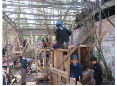
Bau der Hütten

Wer Lust bekommen hat, auch mal mitzumachen: Die nächsten Bauspielplatztage sind voraussichtlich vom 18.-21.07. Wer möchte, kann sich für aktuelle Infos in einen Emailverteiler aufnehmen lassen bei Holle.Huygen@gmx.de .