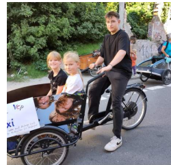
Fahrradtaxi auf dem Straßenfest