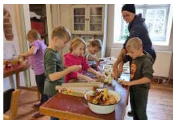
Backen zum Martinsfest