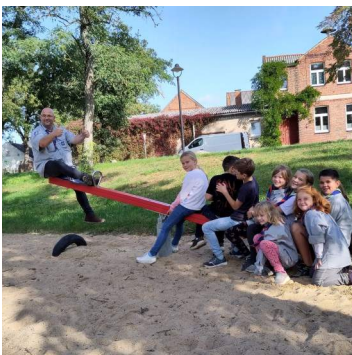
Ausflug Stammestag im September

Stammestermine: 16.-17.12. Friedenslichtfahrt nach Halberstadt 20.-21.12. Waldweihnacht St. Georg 24.-25.02.24 Stammestage zum Thinkingday in St. Georg