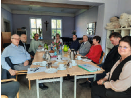
Mitgliederversammlung am 7. April 2024