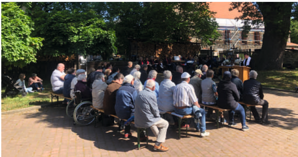
Himmelfahrtsgottesdienst vor der Kuhfelder Kirche