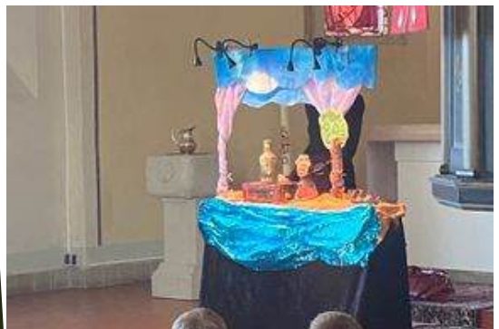
Puppentheater für unsere Jüngsten der Gemeinde