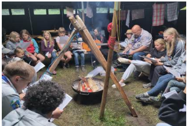
Singerunde am helllichten Tag