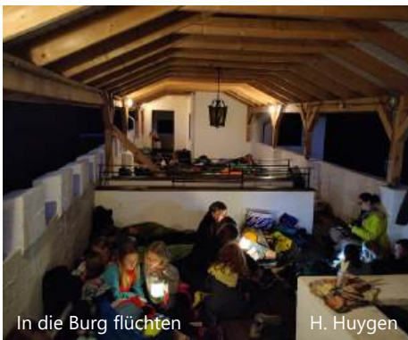
In die Burg flüchten