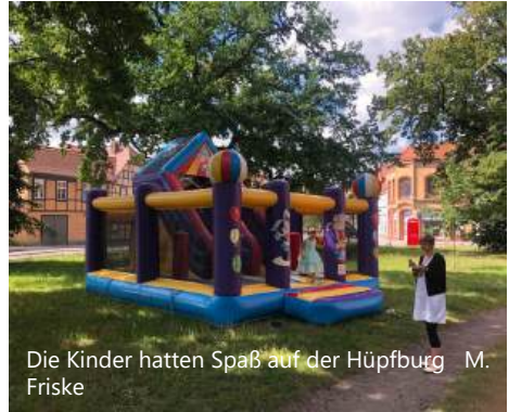
Die Kinder hatten Spaß auf der Hüpfburg M. Friske