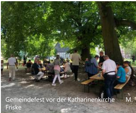
Gemeindefest vor der Katharinenkirche M. Friske