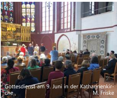
Gottesdienst am 9. Juni in der Katharinenkirche M. Friske