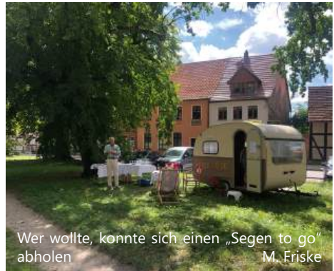
Wer wollte, konnte sich einen „Segen to go“ abholen M. Friske