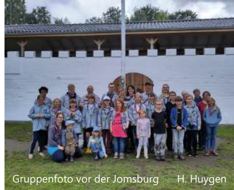
Gruppenfoto vor der Jomsburg H. Huygen