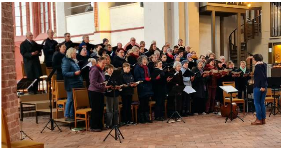
Musikalischer Gottesdienst zusammen mit der Mariengemeinde am Sonntag, 2. November 2025 in der Katharinenkirche