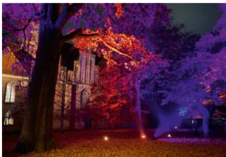
Lichternacht am 7. November 2025 an der Katharinenkirche